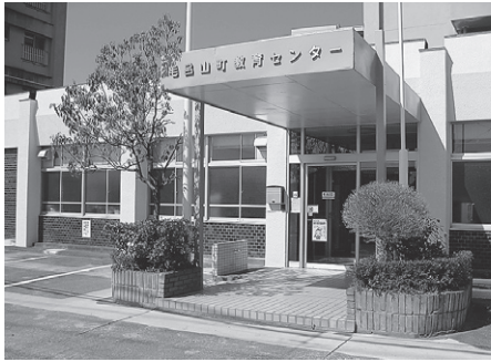
毛呂山町教育センター

E-mail ksenter@town.moroyama.saitama.jp ☎ (295) 0622 FAX (295) 8844