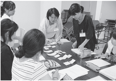
指導者のもと、どのような教育相談のあり方、いろいろな事例への対応の仕方などを検討しあっています。

教育を行ううえで、研修と修養は欠かせません。そこで、体系的な研修や、指導者を招聘しての研修を計画的に取り組んでいます。学校力アップリング中級研修会、教育相談