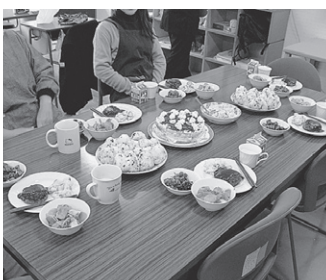
体験的な学習として行った調理実習の様子です。

さまざまな理由で学校への登校が難しい児童生徒のための学習の場、学校への橋渡しの場として適応指導教室を開設しています。個別の補習的な学習、調理実習などの体験的な学習、カウンセリングなどを行っています。