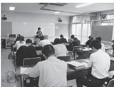
実践的な模擬授業を行うことで、効果的な指導方法を検討します。

時には、参加教員が児童生徒役となり、実践的な模擬授業を行い、効果的な指導方法を検討します。