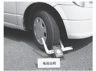
自動車差押用タイヤロック

納める力があるにもかかわらず納付していただけない場合には、やむなく滞納処分を実施することとなります。どうか納期限内の納税にご協力ください。