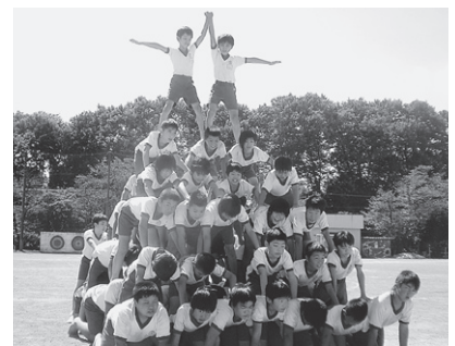
6段ピラミッド完成

光山小の子どもたちはいつも元気で学校が大好きです。今年度も、「不登校児童・ゼロ」を継続中です。秋には、運動会や音楽会、持久走大会など力を合わせて学年や学級全員で乗り越えるべき行事がたくさんあります。友達を思いやり支え合うなかで、互いの絆をさらに深めています。