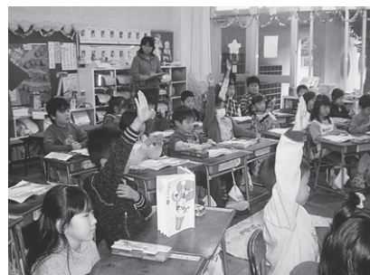
授業研究会・1年生国語

9月からは全学年で視写に取り組み、3年生以上の学年では、辞書引き学習にも積極的に取り組み始めました。