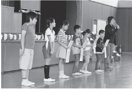
くすの木朝会 (月目標の発表)

光山小では、「知・徳・体」の力をどの児童にもバランスよく身につけさせていくことを目指し、それらの基盤となる力を重点化し、右のように平易で具体的な目標に置き換えて学校生活の3大目標として定め、全校を挙げて取り組んでいます。