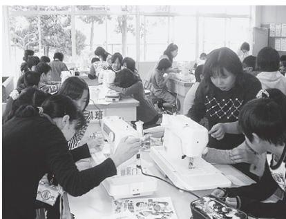
学校応援団 (家庭科ミシン) の支援

光山小は、保護者や地域の皆さんに支えられ、日ごろの教育活動を行っています。後期よりこれまでであった様々な教育支援ボランティアを「学校応援団」として一つに統合しました。