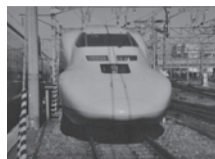
「ドクターイエロー」の写真

気持ちになった」と学校側も感激。このことは、新聞やテレビなどで紹介され、心温まる話として話題となりました。