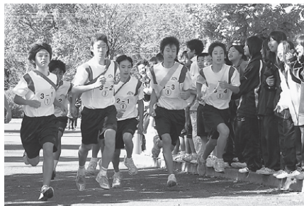
校内マラソン大会