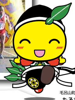
毛呂山町マスコットキャラクター もろ丸くん

取材時によく見かけるのが、ジョギングをしている人たち。里山の風景のなかを季節の風を感じながら走るのはとっても気持ち良さぞ〜。そういえば、毛呂山町はマラソンが盛んな町でもあるんだ。春・夏・秋には、マラソン大会が、冬には駅伝大会が開催され、県内はもとより、全国各地から多くのランナーが走りに来ているんだって。すごいよね。