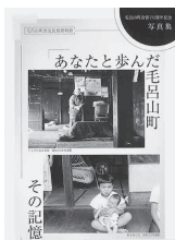
町合併70周年記念写真集(表紙) (全56頁 1冊950円 歴史民俗資料館にて頒布)

現在、日本の代表的な文化の一つとなった漫画やアニメに、多くの子どもたちが影響を受けるようになったのは、昭和30~40年代が一つの転機だったことをこの写真は表しているのではないのでしょうか。 本写真集には、当時の毛呂山の人々の暮らしや懐かしい風景が多数収められています。ぜひお買い求めください。