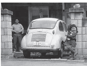
「シェー」のポーズをする子ども