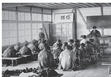
東雲校舎裁縫室の授業風景

実業補習学校で行われた実業補習教育は、施設や制度をかえて、戦後に小学校6年、中学校3年の義務教育と新制高校が始まるまで継続します。寒さの厳しい農閑期に開かれた実業補習学校は、農作業に携わる地域の青少年にとって貴重な学習の機会となっていたのではないのでしょうか。