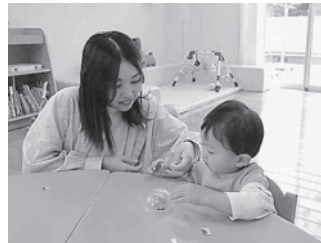
▲毛呂山みどり保育園の様子