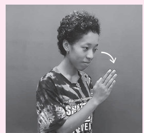
右手を顔の前に立て 軽く頭を下げる

※このコーナーは毛呂山町聴力障害者会、毛呂山手話サークル、手話サロン虹の協力により作成しています。