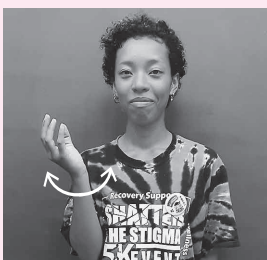
右手首をクルクルひねる (赤色灯の様子)