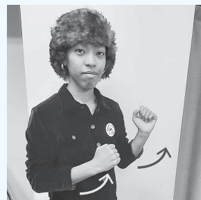
両こぶしを斜めに上げる

※このコーナーは毛呂山町聴力障害者会、毛呂山手話サークル、手話サロン虹の協力により作成しています。