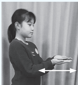
両手のひらを上に向け 前後に動かす