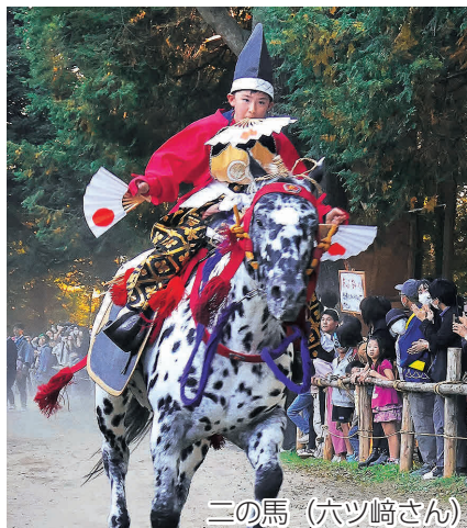
二の馬（六ツ崎さん）