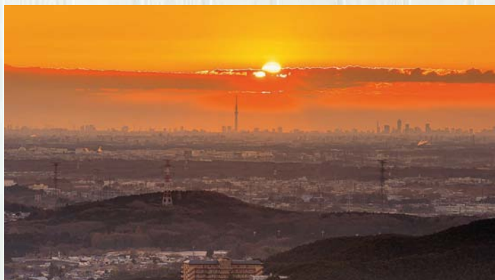
観光協会長賞 『オレンジの夜明け』