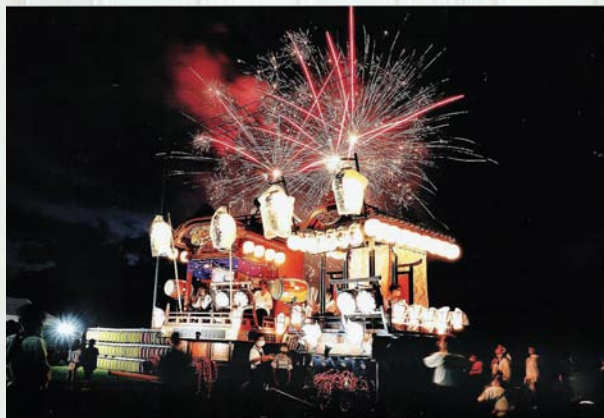
特選 みここのえがお 『祭りの少女』 ただし