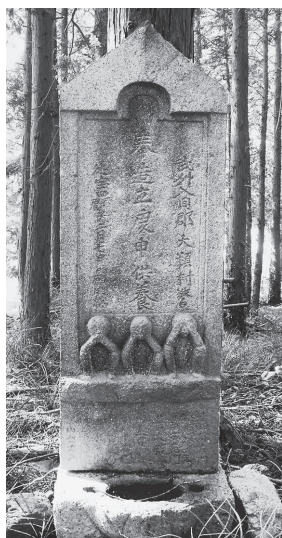
鎌倉街道沿いの古墳上に建てられた大類諏訪台の庚申塔

江戸時代の大類村の人々の思いを今に伝える鎌倉街道沿いの庚申塔をぜひ訪ねてみてください。