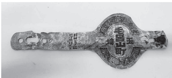
自転車鑑札 (昭和30年)

現在の自動車のナンバープレートのような役割を担っていた鑑札ですが、昭和33年に自転車が廃止されたことに伴い姿を消し、以降は自転車の防犯登録を行うことで自転車と所有者の照会ができるようになりました。 昭和初期以前の毛呂山では、自転車は徒歩よりも速く遠くまで行ける移動手段として通勤通学のほか、荷物や商売道具の運搬など、様々な用途で使われ、県内の移動はどこでも自転車を走らせていました。 特に東武越生線や八高線が毛呂山方面へ開通するまでは、川越、飯能、豊岡(現在の入間市)、小川方面の通学などにはよく自転車を利用され、子どもの進学が決まったときに新車を購入する家もありました。 また、若者や体力のある人は、高尾山(東京都)や横浜(神奈川県)、伊香保温泉(群馬県)など県外まで自転車で旅行に行くこともあったそうです。 自動車普及したことにより、自転車で遠方へ赴くことは少なくなりましたが、暖かくなり始めたこの季節に自転車でちよつと遠くまでお出かけするのもよいかもかもしれません。