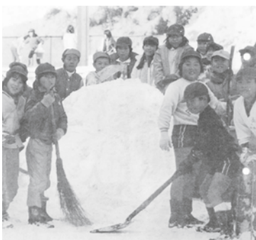
「五九豪雪」の時の毛呂山小学校

近年では雪が降らず暖かい「暖冬」を喜ばしく感じることもありませんが、雪の記録の変化は、温暖化へと向かう地球気候の移り変わりを如実に表しているのかもしれない。