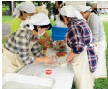
▼「応急救護訓練」(協力：埼玉医科大学病院)