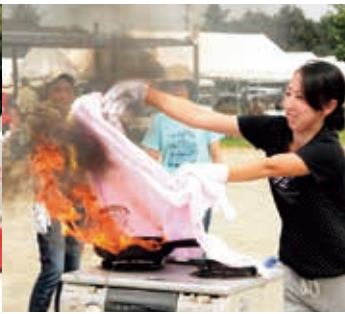
◀◀家庭にある消火器やぬらした布で火を消す「初期消火訓練」