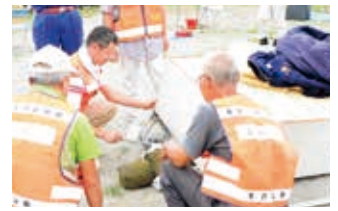
▲家具の下敷きになった人を救出する「救出搬送訓練」