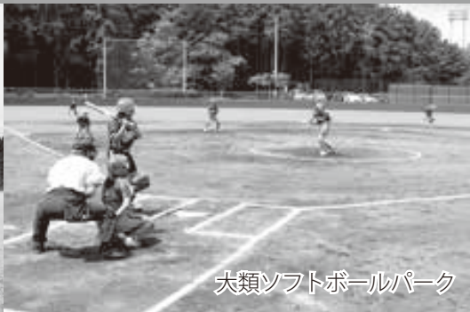
大類ソフトボールパーク