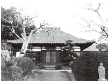
宿谷氏によって開かれたとされる葛貫地区の薬王寺

宿谷氏ゆかりの地を通る古道は、山間を越え高麗へ抜ける飯能道と接続しています。葛貫地区は「本宿」という小字もありますが、毛呂本郷のような街道沿いの宿場町のようなはありません。しかし、葛貫牧の伝承や東西方向に走る鎌倉街道と呼ばれる道の存在は、葛貫地区が江戸時代以前から、河越方面から高麗川を渡り、山間地域へ連絡する重要な場所であったことを伺わせます。八王子と上州（今の群馬県）を結ぶ八王子往還（現在の県道飯能寄居線とほぼ同じ道筋）と古道が交わる葛貫地区は、道と宿の歴史を知る上で興味深い地域です。