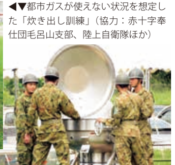
◀▼都市ガスが使えない状況を想定した「炊き出し訓練」(協力：赤十字奉仕団毛呂山支部、陸上自衛隊ほか)