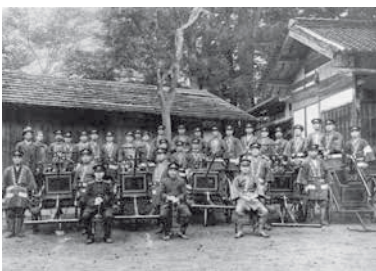
▲旧・山根村の「山根消防団」 (大正15年ごろ撮影)

常備消防組織は昭和23(1948)年に警察から独立し、市町村の責任で行う「自治体消防」に変わりました。毛呂山町にも昭和51(1976)年に毛呂山町と鳩山村(現在の鳩山町)で「毛呂山・鳩山消防組合」を設立。昭和60(1985)年に越生町が加わり、名称も現在の「西入間広域消防組合」に改められました。江戸時代に地域を守るために結成された「町火消し」は、時代とともに名称を変えながら、地域防災の担い手として、今も私たちの安全を守っています。