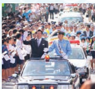
▲平成25年の世界水泳金メダル獲得後の交通安全パレードの様子

平成25年、スペインのバルセロナで開催された世界水泳選手権大会に出場。日本人選手として初めて、400m個人メドレーの金メダルを獲得し、話題となりました。