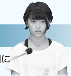
伊藤 颯花 議員

町の特産物をPRするお店を作ってください。ゆずのクッキーやケーキを売り、町の有名なものを紹介すれば、毛呂山町に来たいと思う人が増えると思います。 【答】提案のとおり、特産物のお店をもっと充実させて、流鏝馬の紹介や観光マップを常備すれば、観光客が増えると思います。桂木ゆずをはじめとする特産物を大々的にPRし、地域の魅力をじゅうぶん引き出していけるよう努力して参ります。