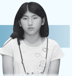
とくだ みむ 徳田 未夢 議員

【答】 お年寄りとの交流の機会を増やすには、学校に来てもらったり、お年寄りが集まる場所へ訪問するなどの方法があります。町でも新しい仕組みを考えて参りますので、議員もぜひご近所のお年寄りに、元気よく話しかけてみてください。