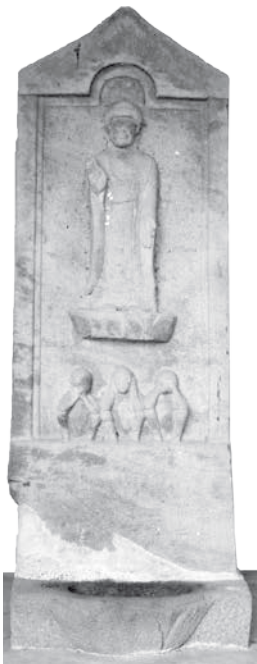
◀西大久保の阿弥陀庚申塔

中して分布しています。毛呂山町周辺では東松山市宮鼻などで確認されているだけで、大変珍しく、貴重なものです。 庚申塔を建てる風習は、江戸時代の村で盛んになった。「庚申信仰」によるものです。60日に一度巡ってくる庚申の日、寝ている間に体に潜む三尸と呼ばれる虫が抜け出して、その人の悪行を天帝に告げ口し、寿命を縮めるとされ、当時の村人は三尸が天に昇らないよう、皆で集まり一晩中寝ずに過ごしました。この集まりを庚申講といい、当時の村人同士の結びつきや助け合いの形をよく表しています。 現在も、西大久保地区では毎年4月中旬に阿弥陀庚申様のお祭りが開催されます。民間信仰の形は時代とともに変わりますが、眼病などを癒すご利益があるとされ、大切にされています。