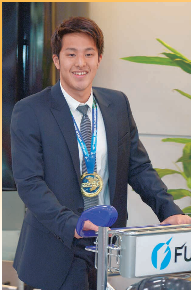
笑顔で帰国した瀬戸大也選手

世界水泳選手権大会の「パブリックビューイング」・瀬戸選手の帰国 ・金メダル&リオデジャネイロ五輪出場内定