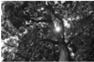
桂木のタブノキ林