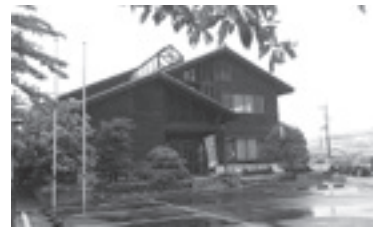
西川広域森林組合（飯能市）

飯能市、日高市、毛呂山町、越生町を管轄し、植林、伐採・間伐、枝打ち、獣害対策、森林相談など山林に関する様々な業務を行っている。