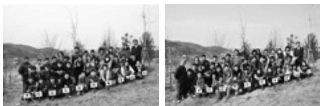
桜の植樹体験をした毛呂山小学校6年生 (平成26年3月)