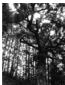
こんびらさま 金毘羅様のスダジイ (滝ノ入)

森が良好な状態であるためには、植える、育てる、伐採する、使うといったサイクルが正常に働く必要があります。このサイクルが正常でないと、良い森ではなくなります。良い状態でない森とは、木材の需要が少ないため木の伐採ができず、間伐もできないために植林もできない