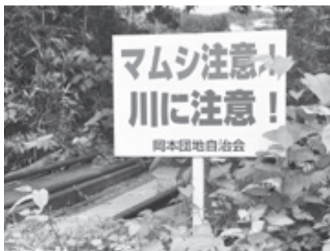
岡本団地内に設置されている注意喚起の看板

役員や自主防災防犯部の部員がお互いに助け合い、地区で出来ることは自分たちの力で、それでも足りない所を行政に頼る。岡本団地は、まさに自助・共助・公助を実践しようとしている地区といえるのではないのでしょうか。