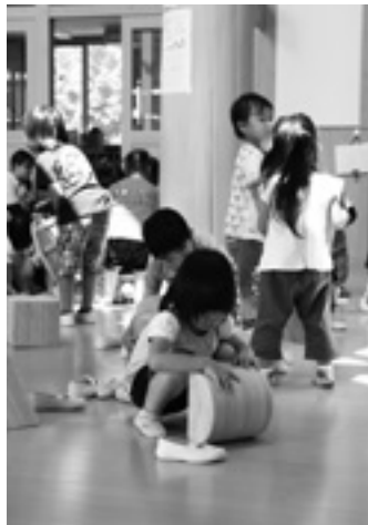
広い園舎で遊ぶ園児たち