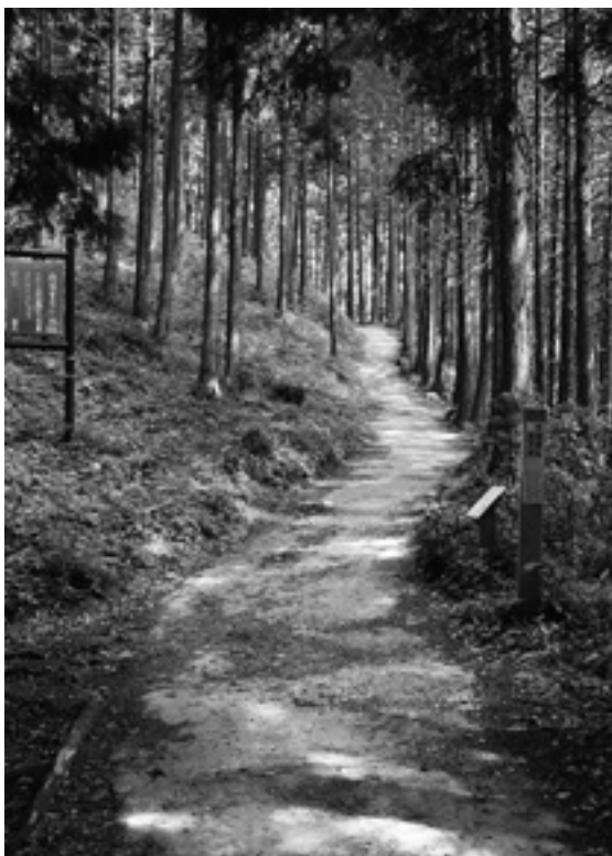
奥武蔵自然歩道は、毛呂山町の鎌北湖から飯能市の天覧山を結ぶ全長約11キロメートルのハイキングコース。道は整備されていて歩きやすい。