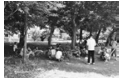
熱心に授業に取り組む児童たち