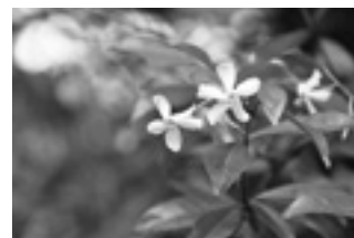
可愛らしい花にも出会える