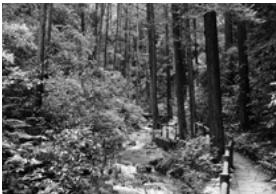
宿谷の滝へと向かう道。道の脇を宿谷川が流れ、夏はとても涼しい。