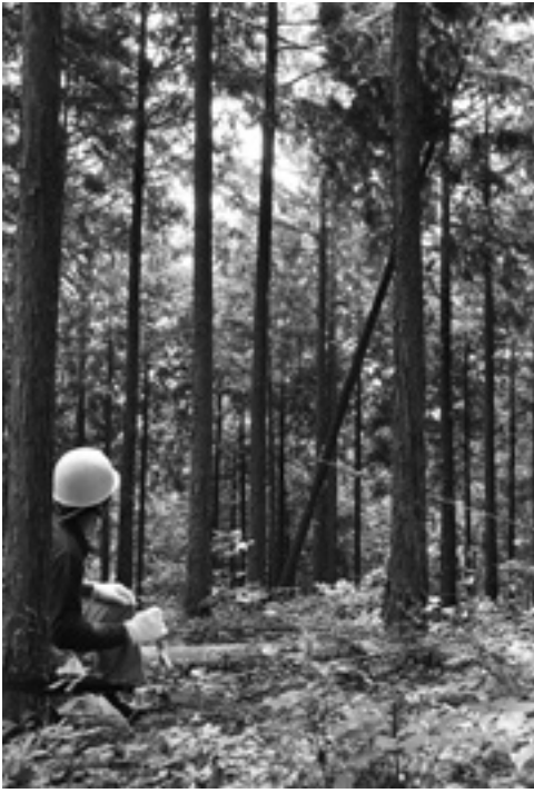
ワイヤー使い、周囲に細心の注意を払いながら、引き倒す。

成長させても木材として需要価値が低い木を選び間伐する。間伐する木に引き倒すためのワイヤーを括り付ける。