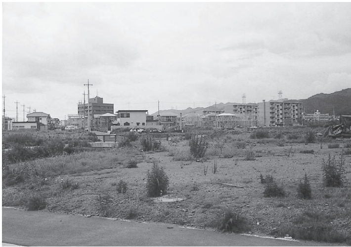
宮前都市下水路琵琶橋付近から役場方面（岩井西地内） 昭和59年ごろ

宮前都市下水路琵琶橋付近から役場方面を見た写真です。当時は、団地造成の最盛期で、骨組みだけの家や瓦で屋根を葺く前の家などが見られます。現在は、手前の空き地にも家が立ち並び、当時とは様相が一変しています。