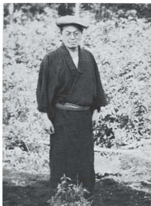
毛呂山に新しき村を開村したころの武者小路実篤