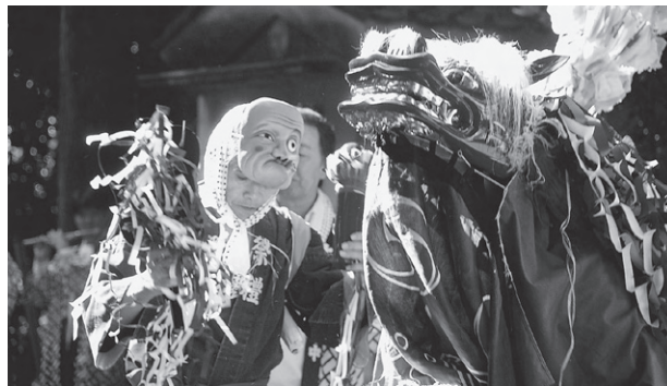
十社神社の獅子舞（大類地区）

10月10日に、滝ノ入、大類、葛貴地区 つづらぬき で、17日には川角地区で獅子舞の奉納が行われました。この行事は、五穀豊穡に感謝し、疫病退散や人びとの平安を願って行われるものです。笛や太鼓、さららの音に合わせながら、3頭の獅子が華やかな舞を披露しました。獅子やそれぞれの役を小中学生が演じた地区もあり、日ごろの練習の成果を惜しみなく発揮していました。勇壮で迫力のある獅子たちの演技に、観客から大きな拍手が沸き起こりました。