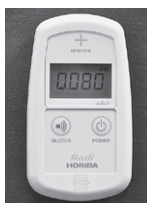
貸出用簡易放射線測定器