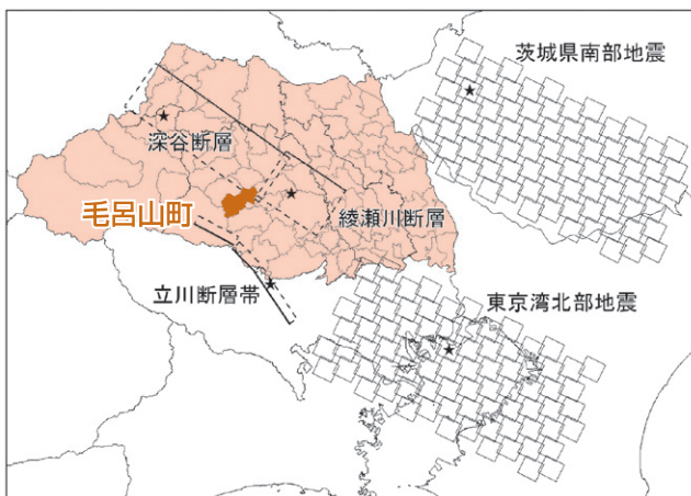
想定される地域と被害予測図