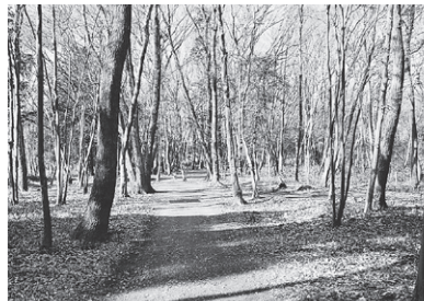
景観樹林として指定され、整備された雑木林

現在、毛呂山町内では、川角地区の約1.3ヘクタールが「景観樹林」として指定され、良好な景観の保全が図られています。指定された雑木林では、町民の皆さんにウォーキングなどの健康維持の場として、利用されています。今後も、毛呂山町では、これらの雑木林の景観や自然が失われる前に、自然環境の保全を図り、町民と皆さんと協働して潤いのある生活ができるように努めていきます。