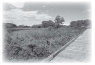
三ツ又沼ピオトープ

荒川の河口(東京湾)から上流に48キロメートルのぼったところ、上尾市、川越市、川島町の境の荒川河川敷を公有地化し、整備した自然公園です。平成13年4月に三ツ又沼ピオトープ(野生生物の生息空間)約13ヘクタールを4年の歳月をかけ完成させました。三ツ又沼とそのまわりには、昔から植物が豊かに茂り、オオタカやイタチ、トンボなどたくさんの生き物が暮らしています。その中では、「埼玉県の蝶」であるミドリシジミが見られます。四季をとおして、いろいろな生物が現れるので、一度、散策してみてください。