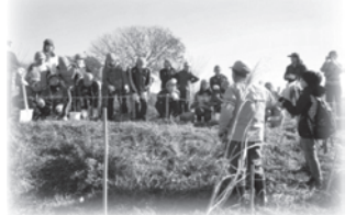
ハンノキプロジェクトに取り組む小学生

ミドリシジミの幼虫のえさとなるハンノキが減りつつあることから、荒川の自然再生を目的とした「荒川ハンノキプロジェクト」が行われています。この活動は、地元の小中学生がハンノキを種子から育てて、苗を植えるものです。夏には、『ミドリシジミに会える夕ぐれの観察会』も行われています。