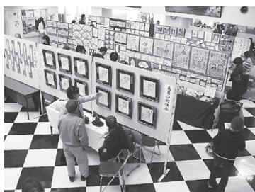
昨年の会場の様子

内容 展示部門、舞台部門、体験教室(手話体験、水引体験、絵手紙体験、茶道体験、箏体験)、模擬店部門(焼きそば、だんご、綿菓子、ポップコーンなど)