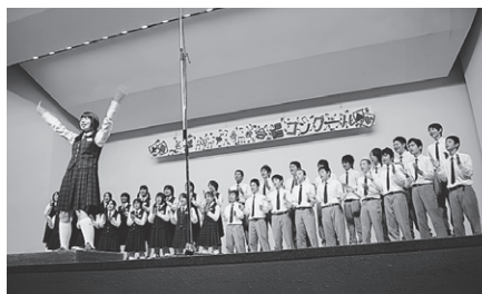
感動のハーモニーが 会館内に響いていました！

本番の合唱は、本校の歴史に残る感動的なものでした。福祉会館の壁が、天井が、ピリピリと震える…そんな勢いを感じる合唱でした。一番間近で聴いていた1年生にとっても、来年度以降の大きな財産となったことでしょう。