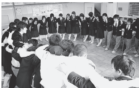
円陣を組んで、いざ出陣！

放課後の下級生との練習では、「後輩に自分たちの想いを伝えたい」というメッセージも感じられました。