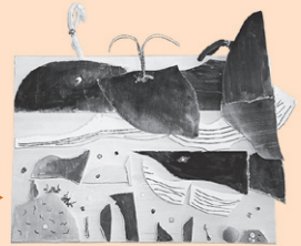
「くじらのおやこと 魚たち」