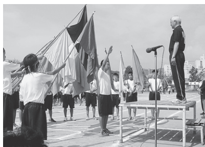
委員長による選手宣誓 熱いメッセージが五月晴れの空に届け！

分の持てる力をすべて出し切り、勝負に勝って抱き合う姿あり、想い届かず涙ぐむ姿あり、見ている人たちに多くの感動を与えてくれました。