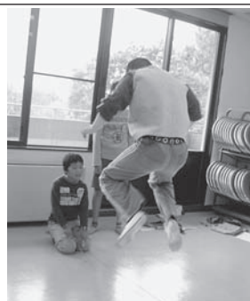
あいあい作業所での学習活動