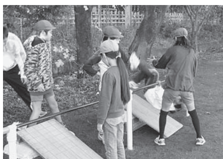
1、2年生に鉄棒を教える運動委員会の児童

この活動をとおして、上級生には責任感を、下級生には教わる喜びを体験させ、一人でも多くの児童が逆上がりができるようになるようがんばっています。