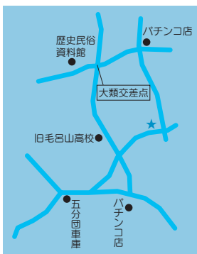
★「オークガーデン」の場所 住所：毛呂山町大字西大久保 100-2

※オープンガーデンを訪れるときは、タバコやペットの禁止、近隣の住民に迷惑をかけないなどの注意事項を守り、オーナーにお声かけのうえご覧ください。