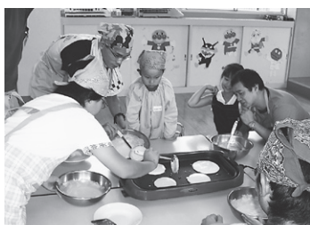
おやじ広場「パパと簡単クッキング」の様子