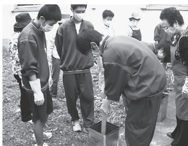
廃油の石けんづくり

11月に3年生がクラスごとに幼稚園を訪問しました。授業で各自が考えて作ったおもちゃを持って行って、園児の皆さんと交流しました。小さな園児たちと優しくじゃれ合おう大きな男子生徒が印象的でした。