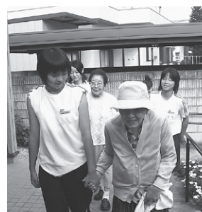
デイサービスセンターでの体験