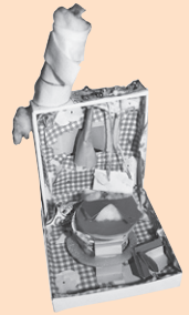
「おんせんやさんの おうち」