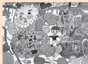
「にぎやかな ひょうたんの世界」