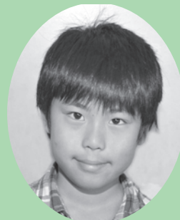
5年 ほらだ 洞田 みなと 港くん