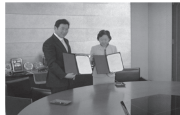
城西大学との協定書調印式

また毛呂山町では、昨年9月に城西大学とも同様の協定を締結しており、これで2例目となる協定の締結となりました。