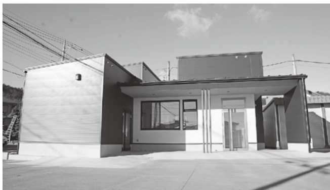
毛呂山町を世界にアピール!

【答】 ゆずの販路については町から東京太田市場へ働きかけをし、冬至用ゆずとして都内スーパーに陳列され、市場入荷を要望されています。今後も『官と民』の連携を強め、商品開発や加工販路開拓などを進め、桂木ゆずなどが周知されるように努力をしていきます。