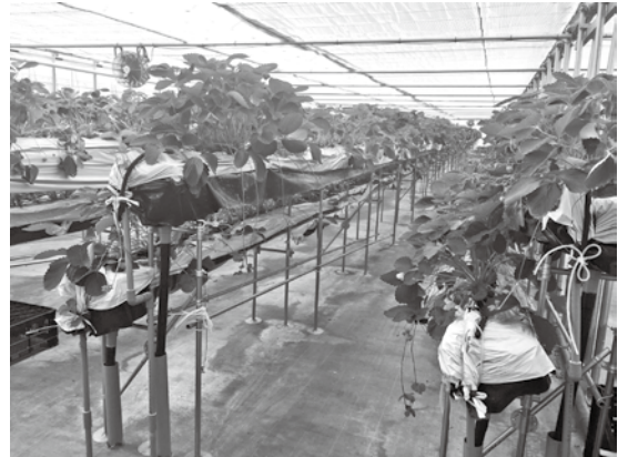
いちご栽培で町に活気を！