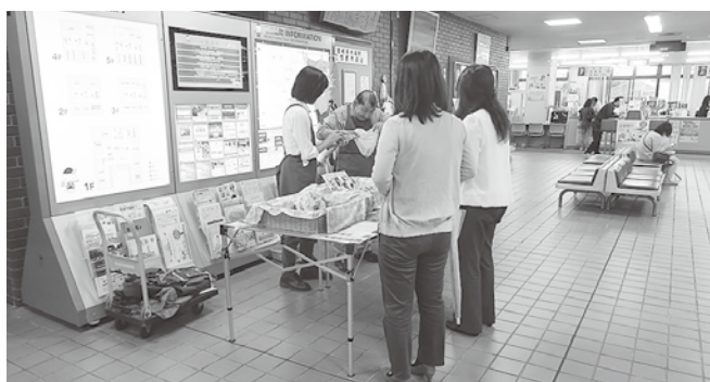
物品等の調達のほか、販売機会の確保も重要

問 全ての旅行者に、通信環境の整備と多言語対応による情報発信等は重要ご見解は。 答 無料通信環境の整備すること、有効な通信手段、手法は、調査・研究します。