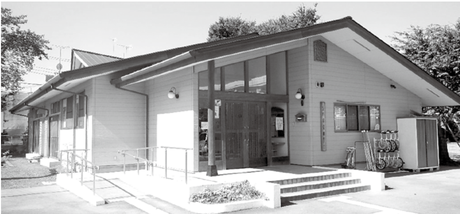
学童保育の充実を！

Q 町長が適当と認める定義は。 A 目安として総勤務時間5千時間、総勤務日数千日程度に加え、勤務姿勢が適正であること。