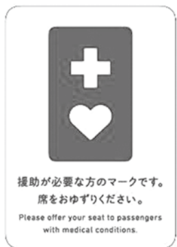
ヘルプマークは援助を必要としているマークです

問 糖尿病重症化予防 答 糖尿病の値が異常に高く、医療機関未受診者に対し受診を促し結果を保険センターに報告頂く。2か月以内に未報告の方へ直接強い受診勧奨を行っている。