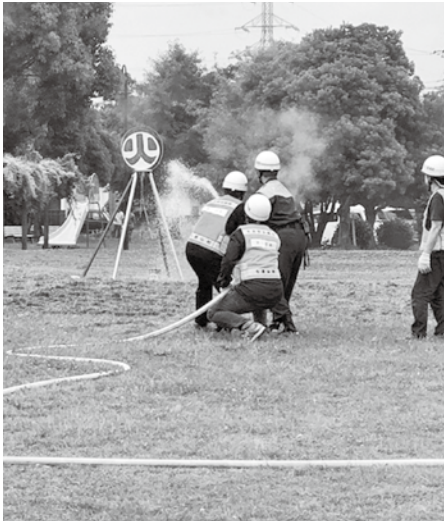
守ろう！自分たちの地域防災

地域の営農戦略として定め、すべての農産物を対象として意欲のある農業者等が高収益な作物栽培体系への転換を図るため総合的に支援する事業。