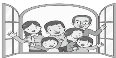
毛呂山町地域福祉計画