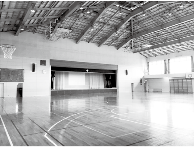
12月には工事が完了し綺麗に蘇る体育館