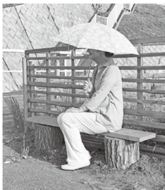
見守りボランティアさんへ「ひとやすみの椅子」

答 要望は多種多様で予算が必要なもの等、即答できないこともあるが、各行政区との信頼関係は重要であり、誠意ある対応が大切と考えます。行政区から出された要望については、その都度、町の考えや対応を回答できるよう、全庁を通して調整を図って参ります。