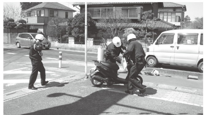
事故の絶えぬ西大久保交差点

【問】 町民皆さんから崇徳寺の「延慶の板碑」安置場所を元に戻してほしい。との意見を複数聞いている。 【答】 移動は板碑の破損などで困難。又、板碑の位置が特定できず、現段階では難しいものと考えている。 【問】 現代の移動技術を活用。位置も「県指定遺跡」故に特定できるものと考えている。 【答】 埼玉県屈指の中世遺跡群①川角古墳群②鎌倉街道③苦林宿跡を合わせた公園化と全町民の議論が必要だ! 【問】 充分検討して行きたい。