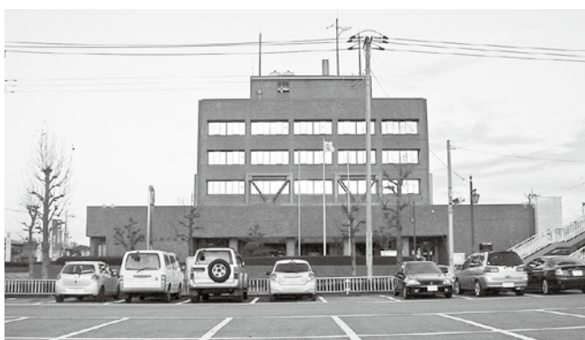
厳しい統計結果を抱えたままの毛呂山町

意見 職員のモチベーションを高めてほしい。政治倫理条例に関する件の取扱いは法の場に出される危惧もある。最高裁判例等を精査し、慎重にお願いしたい。