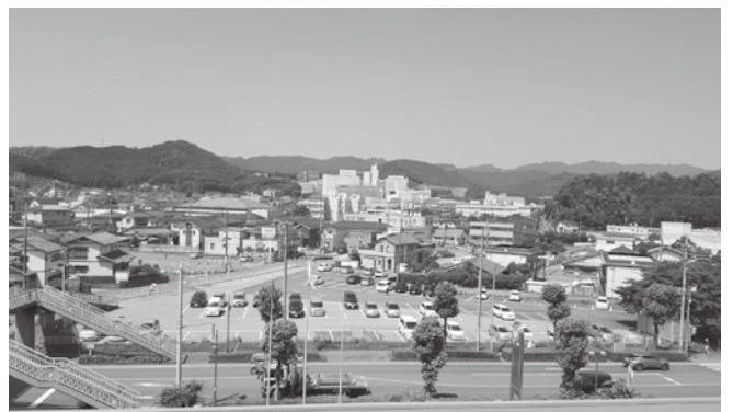
医療と福祉の連携の町