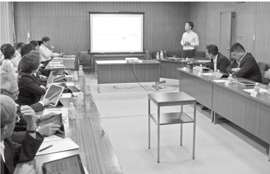
国会でも一部資料のペーパーレス化の導入が検討されている

5月22日全員協議会において、議会活動の活性化や紙資料の削減に向けて、タブレット端末の操作体験を実施しました。先進地の事例や費用対効果など、活発な質問や意見交換が行われました。