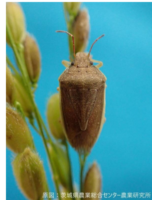
イネカメムシの成虫