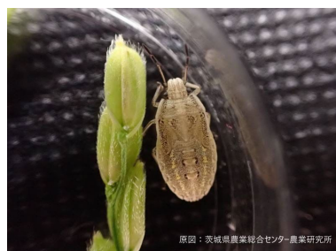
イネカメムシ幼虫（5齢）