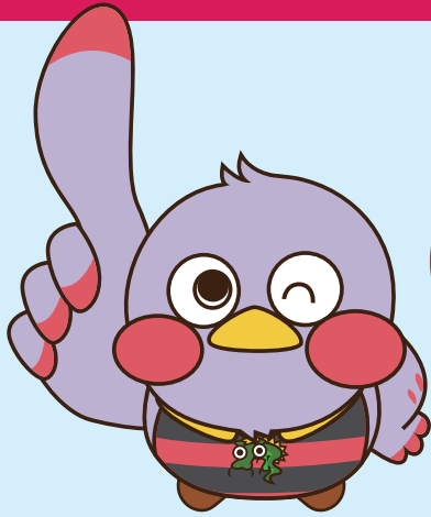
埼玉県マスコット 「さいたまもっち」