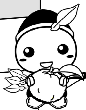
毛呂山町けんこう大使 もろ丸くん

各種健診・検診、献血、ウォーキングなどの対象事業に参加して20ポイント貯めましょう。対象事業によりポイント数が異なりますので、本紙裏面をご確認ください。