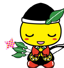
毛呂山町マスコットキャラクター もろ丸くん

「〇〇で困っているけど、 どこに相談したらいいだろう・・・」と 迷ったときにご連絡ください。