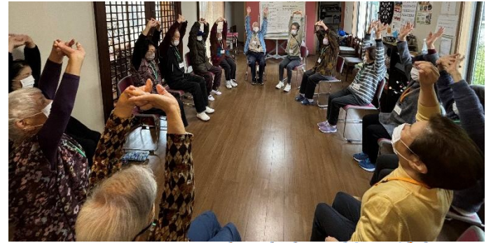
あったか オレンジカフェ