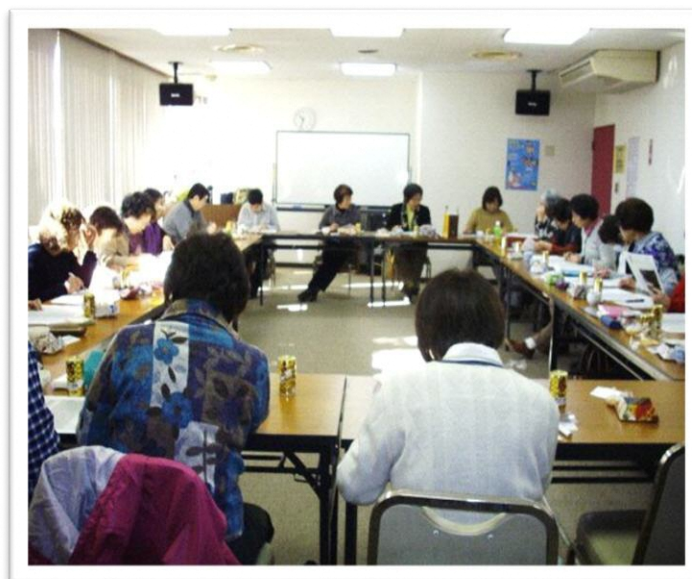
☆毎月スタッフが集まり、利用者様の対応や活動について話し合いをしています☆

友愛毛呂山は、ボランティアスタッフによる有償の家事援助サービスグループです。生活支援や外出支援など利用者様の希望に合わせた活動を行っています。