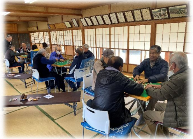
～滝ノ入地区の様子～

ふれあい・いきいきサロンとは、 各行政区で住民交流や世代間交流を 目的に実施しているサロンです。 地区の実情に応じてさまざまな活 動を行っています。