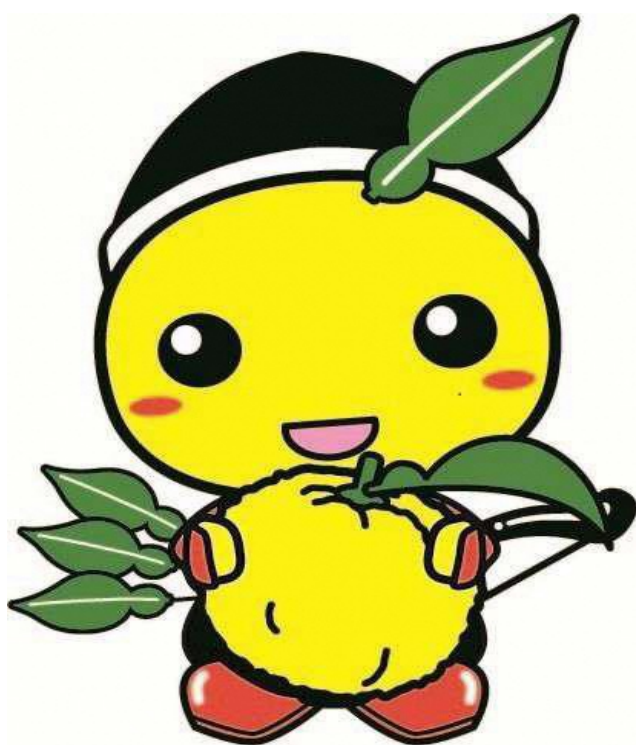
もろ丸くん(毛呂山町)