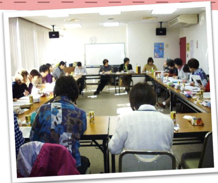
☆毎月スタッフが集まり、利用者様の対応や活動について話し合いをしています☆

友愛毛呂山は、ボランティアスタッフによる有償の家事援助サービスグループです。生活支援や外出支援など利用者様の希望に合わせた活動を行っています。