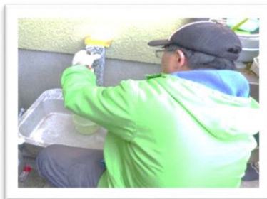
(水道パッキンの交換)