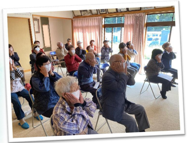
～苦林地区 いきいきサロンの様子です～

ふれあい・いきいきサロンとは、 各行政区で住民交流や世代間交流を 目的に実施しているサロンです。 地区の実情に応じてさまざまな活 動を行っています。