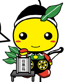
毛呂山町マスコットキャラクター もろ丸くん