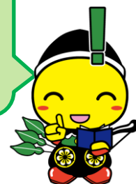
毛呂山町マスコットキャラクター もろ丸くん