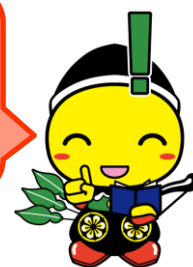
毛呂山町マスコットキャラクター もろ丸くん