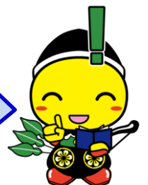
毛呂山町マスコットキャラクター もろ丸くん