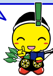
毛呂山町マスコットキャラクター もろ丸くん