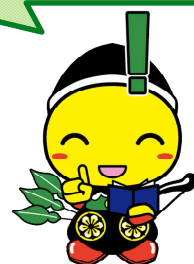
毛呂山町マスコットキャラクター もろ丸くん