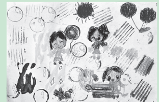
「しゃぼんだまいっぱい」